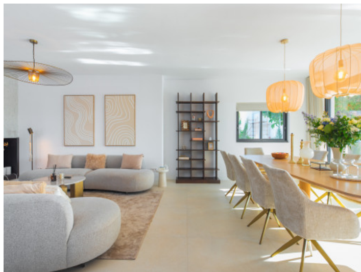
Salón y comedor