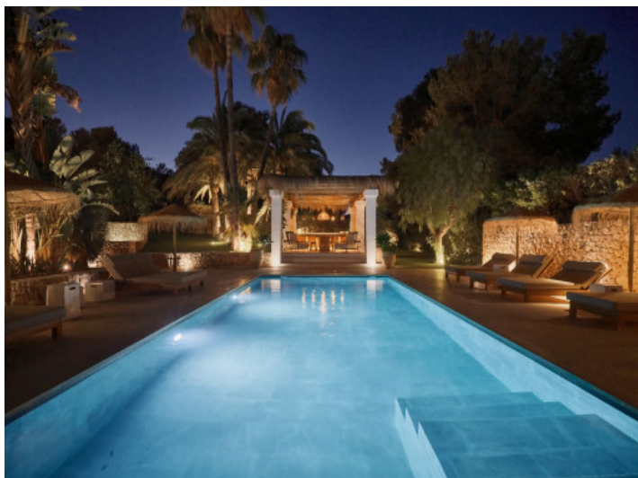
Villa al atardecer