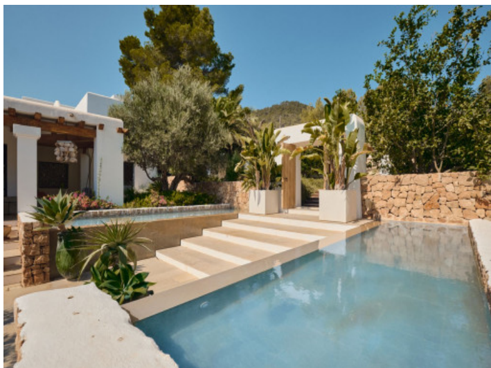
Entrada a la propiedad