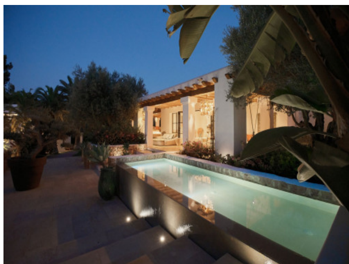
Fachada y piscina

Toda la información como mejor se puede saber, salvo por error durante el periodo de venta. Sirva este documento como un informe previo, las bases legales solo serán válidas a través de un contrato de compra acordado ante Notario.