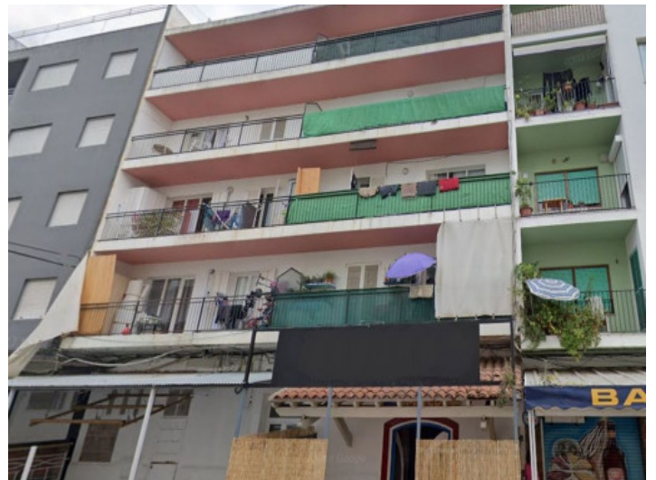
Vista exterior de la casa

Toda la información como mejor se puede saber, salvo por error durante el periodo de venta. Sirva este documento como un informe previo, las bases legales solo serán validas a traves de un contrato de compra acordado ante Notario.