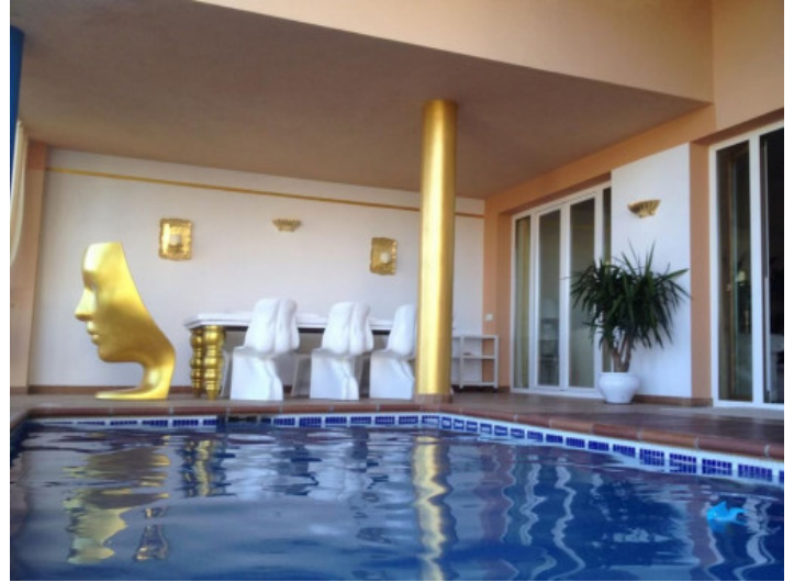
Piscina privada calefactable