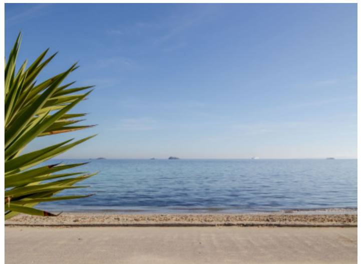
Playa frente del apartamento

Toda la información como mejor se puede saber, salvo por error durante el periodo de venta. Sirva este documento como un informe previo, las bases legales solo serán válidas a través de un contrato de compra acordado ante Notario.