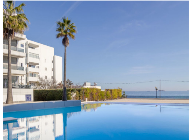
Ubicación den frente de la playa