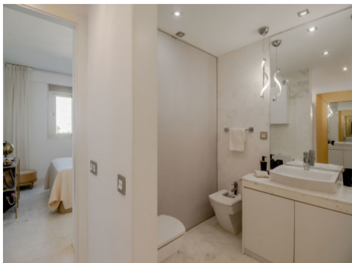
Baño en suite