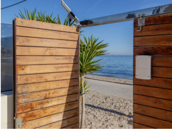
Acceso a la playa