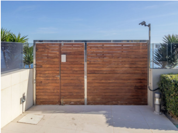
Acceso a la playa