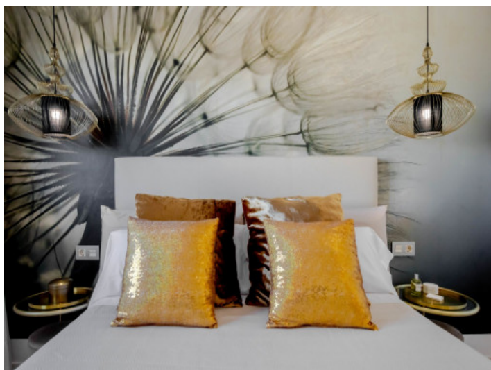
Uno de 2 dormitorios