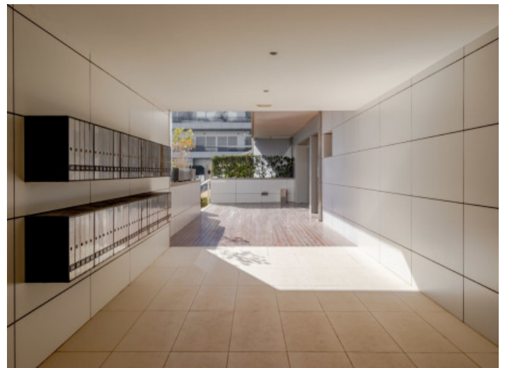
Entrada del edificio

Toda la información como mejor se puede saber, salvo por error durante el periodo de venta. Sirva este documento como un informe previo, las bases legales solo serán válidas a través de un contrato de compra acordado ante Notario.