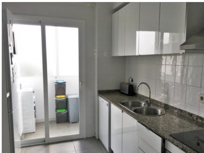
Cocina totalmente equipada