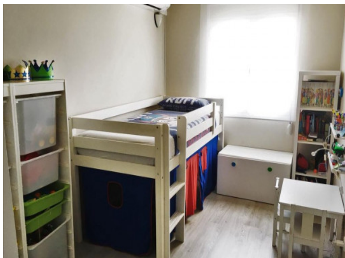
Uno de 3 dormitorios