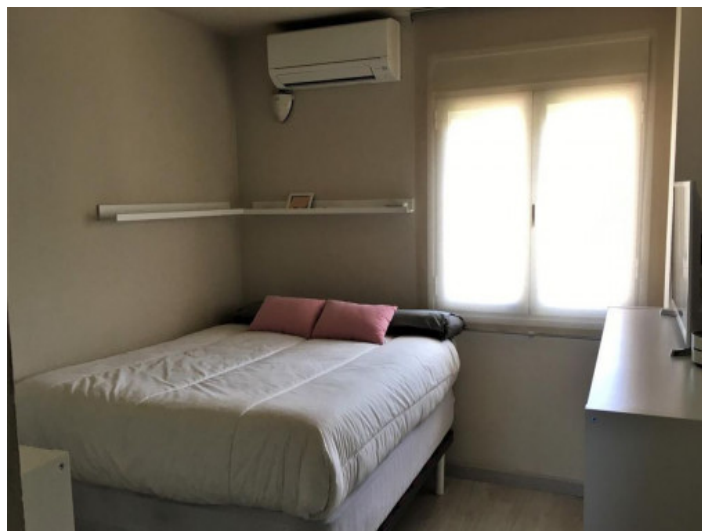
Uno de 3 dormitorios