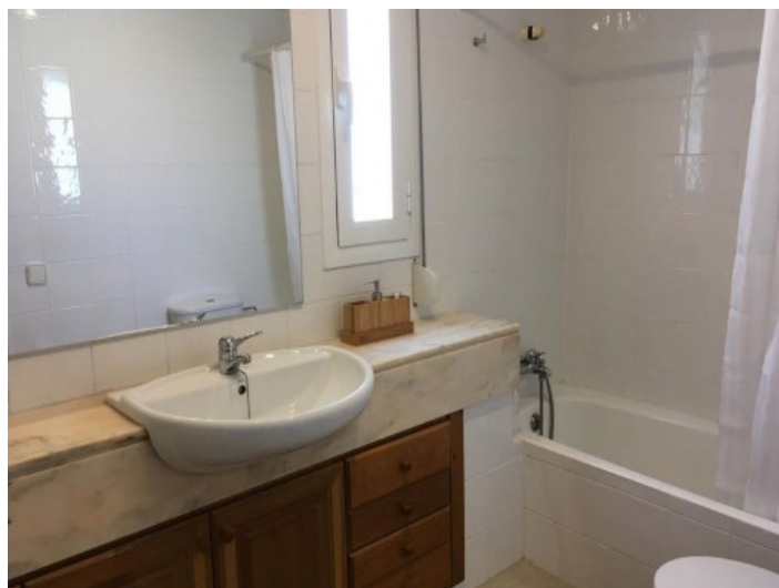
Baño con bañera

Toda la información como mejor se puede saber, salvo por error durante el periodo de venta. Sirva este documento como un informe previo, las bases legales solo serán válidas a través de un contrato de compra acordado ante Notario.